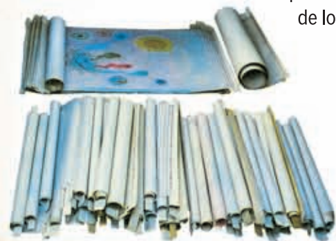
Los Rollos del Cordero de Dios (Apocalipsis 5)

Proyecto Libro Comunitario Publicando los libros de la justicia de las masas populares y de la justicia del pueblo.