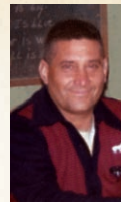
Alfa y Omega, Enviado del Divino Padre Eterno, Autor de la Ciencia Celeste.-

Ninguna ley humana ó ciencia terrestre, podrá jamás explicar su propio origen; tiene que ser un Enviado del divino Padre; con una nueva Doctrina; salida del universo viviente; pues toda Doctrina posee también un libre albedrío; es por eso que por su fruto se conoce, del árbol que proviene; toda Doctrina del Padre, transforma los mundos; pues todas las demás, están subordinadas, a la Santísima Trinidad, en la Trinidad; toda Doctrina que no es del Padre, probada es; y no tiene el divino sello de la eternidad; puesto que pasa al olvido, tarde ó temprano; la divina Doctrina de la Ciencia Celeste, es eterna; está llamada a iniciar el Milenio de Paz, conque nace el nuevo mundo; un mundo tan fascinante, como justo; en que la filosofía de los niños, reinará por toda eternidad; con ello triunfa el divino pensar, de un divino Corderito; venido del Reino de los Cielos.-