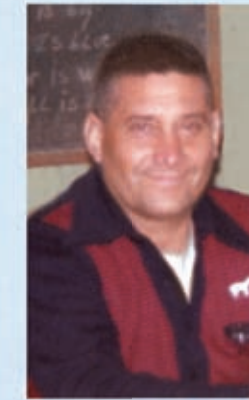
Alfa y Omega, Enviado del Divino Padre Eterno, Autor de la Ciencia Celeste.-

El Juicio que se os avecina, es Juicio Intelectual; pedido por vosotros mismos; porque todo se pide en el Reino; el Juicio Final se extenderá por toda la Tierra; las Escrituras Telepáticas del Cordero de Dios, serán traducidas a todos los idiomas de la Tierra; porque lo que es del Padre, es eterno.-