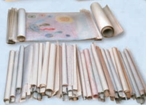
Los Rollos del Cordero de Dios (Apocalipsis 5)