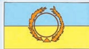
Bandera del Milenio de Paz