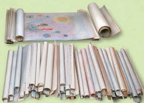
Los Rollos del Cordero de Dios (Apocalipsis 5)