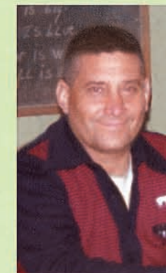
Alfa y Omega

Enviado del Divino Padre Eterno, Autor de la Ciencia Celeste.-